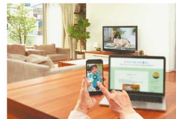
2つの焦点距離にあるものがクリアに見える