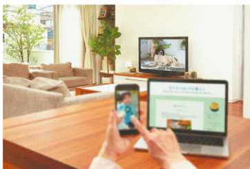
ピントを合わせた距離のものが非常にクリアに見える