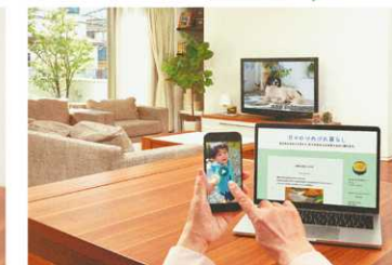
3つの焦点距離にあるものがクリアに見える